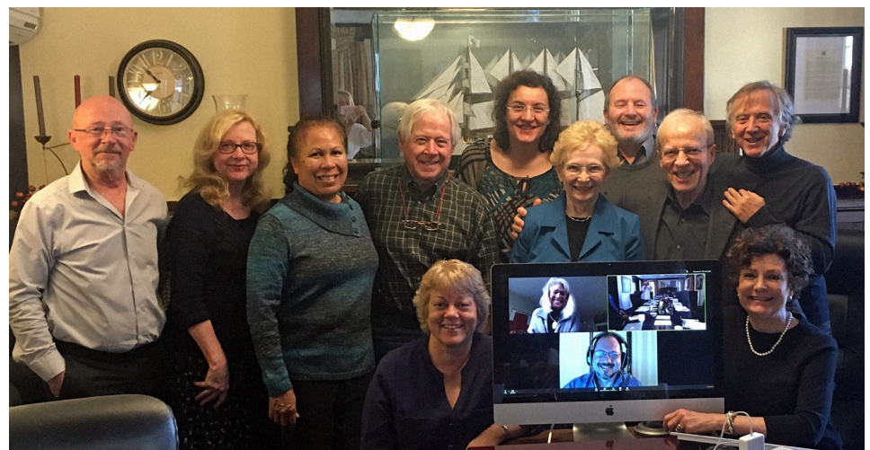
Junta directiva de la UBIS