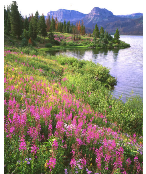
Trappers Lake Fireweed

la Fundación Urantia y está dedicado a promover y apoyar el estudio de primera mano de El libro de Urantia de manera amistosa, no invasiva y no interpretativa.