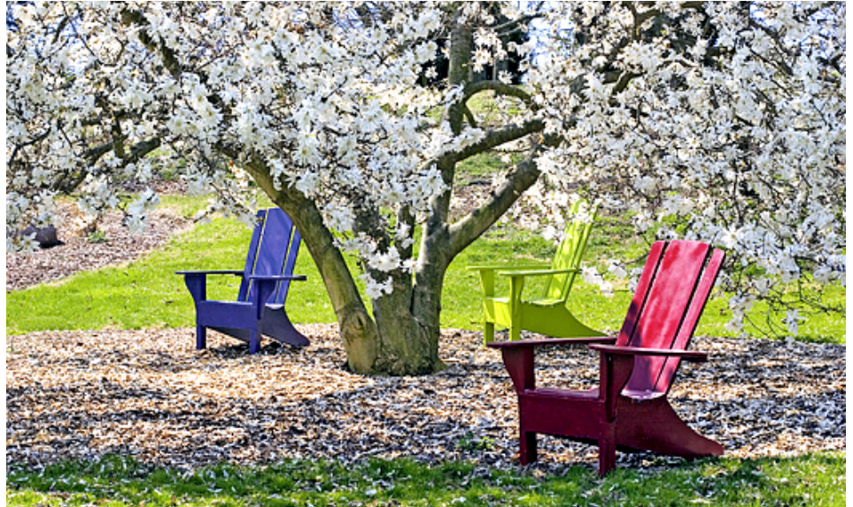
Hay muchas oportunidades para servir a Dios a través de la UBIS.