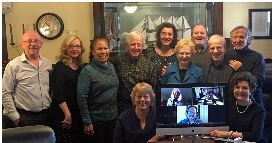
Diretoria da ELUI/UBIS