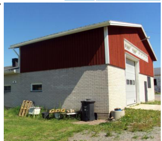
Het Finse boekendepot