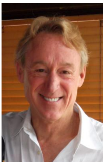
Door Mo Siegel, President van de la Urantia Foundation, Boulder, Colorado, Verenigde Staten

In zo'n 56 jaar is de Revelatie van een handjevol gelovigen in Chicago geëvolueerd naar lezers in de hele wereld. Het licht van de vijfde epochale openbaring schijnt nu op praktisch elk continent van onze planeet. Van drie verkochte boeken in 1958 is het een lange weg geweest naar de 750.000 boeken die op dit moment wereldwijd zijn verspreid. Wat vanaf nu gebeurt, is moeilijk te voorspellen. Zal de Urantia-openbaring op een langzame en meer geïnstitutionaliseerde manier geschieden of zal het de verbeelding van de wereldbevolking beetpakken zoals dat gebeurde met de leringen van Jezus in Damascus 1700 jaar geleden?